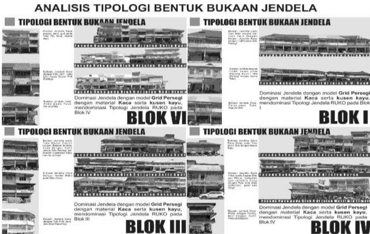
Gambar 3. Analisis Tipologi Bukaan Jendela pada Kawasan Pasar Hongkong