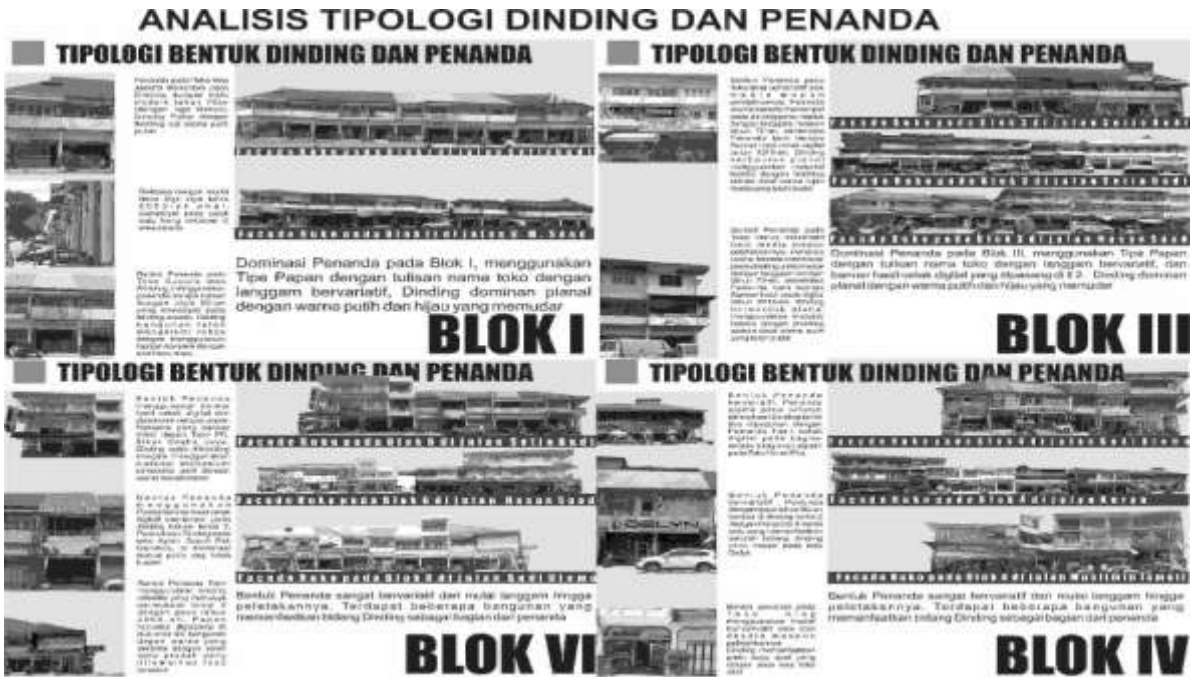
Gambar 4. Analisis Tipologi Bentuk Dinding dan Penanda pada Kawasan Pasar Hongkong