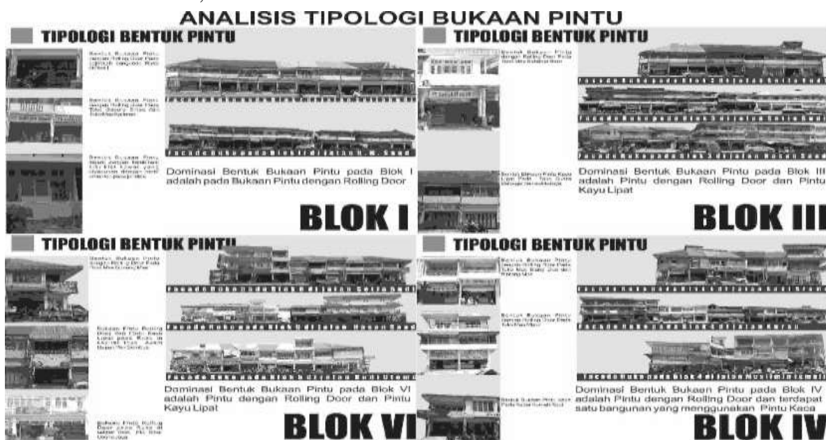
Gambar 2. Analisis Bukaan Pintu pada Kawasan Pasar Hongkong