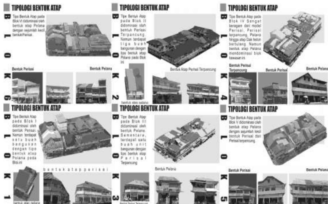
Gambar 6 Analisis Tipologi Shading pada Kawasan Pasar Hongkong