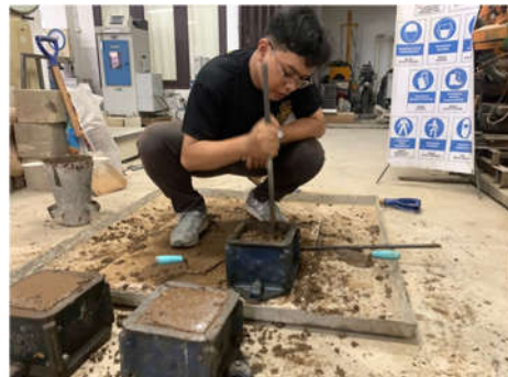
Gambar 3. Sampel Adukan