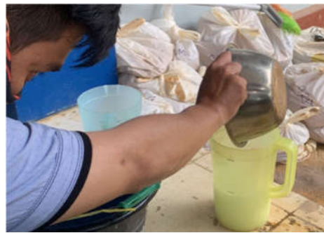
Gambar 2. Pembuatan larutan cair (zat aditif)

Material Uji yang dipakai dengan menggunakan 3 variasi, yakni, variasi pertama menggunakan abu terbang 10 gram, serat basalt 10 gram dan KOH gram, dan pasir 3 kg, variasi pertama ini ditambahkan 10 gram serat aditif. Variasi ke dua, sama seperti material pertama, hanya ditambahkan 20 gram serat aditif, dan variasi ke tiga juga sama seperti variasi pertama, hanya ditambahkan 30 gram serat aditif.