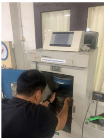
Gambar 5. Pengujian Kuat Tekan