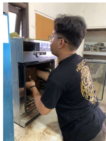
Gambar 4. Oven Sampel