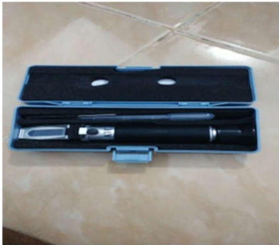
Gambar 2 Alat Pengecek Kadar Garam

Pengecekan nilai kadar garam yang terkandung pada pasir pantai Jawai sebelum dicuci dan sesudah dicuci menggunakan alat Refraktor Salinitas mendapatkan hasil analisis kadar garam sebagai berikut.