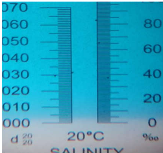
Gambar 3 Alat Pengecek Kadar Garam

Pengecekan nilai kadar garam yang terkandung pada pasir pantai Jawai sebelum dicuci dan sesudah dicuci menggunakan alat Refraktor Salinitas mendapatkan hasil analisis kadar garam sebagai berikut.