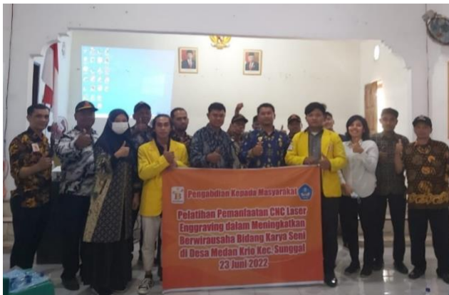
Gambar 2. Foto Bersama Peserta