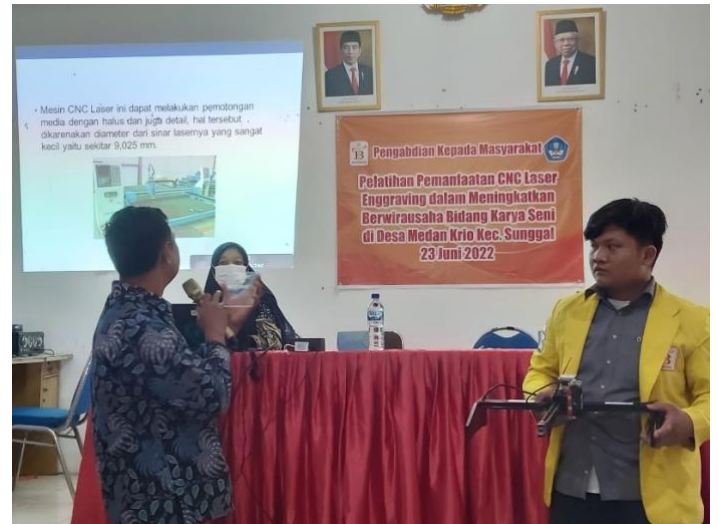
Gambar 3. Sesi Penjelasan Secara Teori