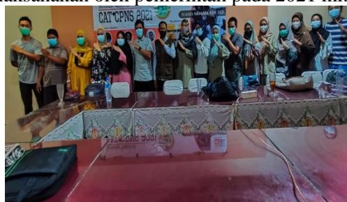
Gambar 3. Foto Bersama Peserta Kegiatan Pelatihan CAT CPNS 2021

Dampak yang diperoleh dari pelatihan ini adalah para peserta pelatihan lebih siap dan termotivasi dalam rangka menghadapi tes CAT yang akan dihadapi dalam tes CPNS yang akan dilaksanakan oleh pemerintah pada 2021 ini.