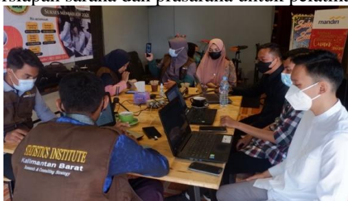
Gambar 1. Rapat Persiapan Kegiatan Pelatihan CAT CPNS 2021

Kegiatan Survei pada lokasi pelaksanaan yaitu Aula Galaherang Jalan Sepakat 1 Ahmad Yani, Kota Pontianak. Permohonan izin kepada pengurus Aula Galaherang terkait rencana pelaksanaan pelatihan pada lokasi tersebut. Pengurusan administrasi surat-menyurat. Persiapan sarana dan prasarana untuk pelatihan.