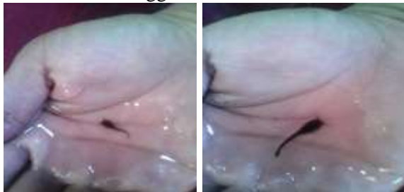
Gambar 3. Penen Benih Ikan Lele Ukuran 3-5 Cm dan 5-7 Cm.

Benih yang dipanen pada kegiatan PKM ini berukuran 3-5 cm dan 5-7 cm dengan masa pemeliharaan 2 hingga 3 minggu dan dipasarkan disekitaran wilayah Kabupaten Kapuas Hulu dan Kabupaten Sintang. Proses panen benih dilakukan oleh pembudidaya dan dimonitoring secara intens. Panen dilaksanakan pada akhir bulan Januari hingga akhir bulan Februari 2017.