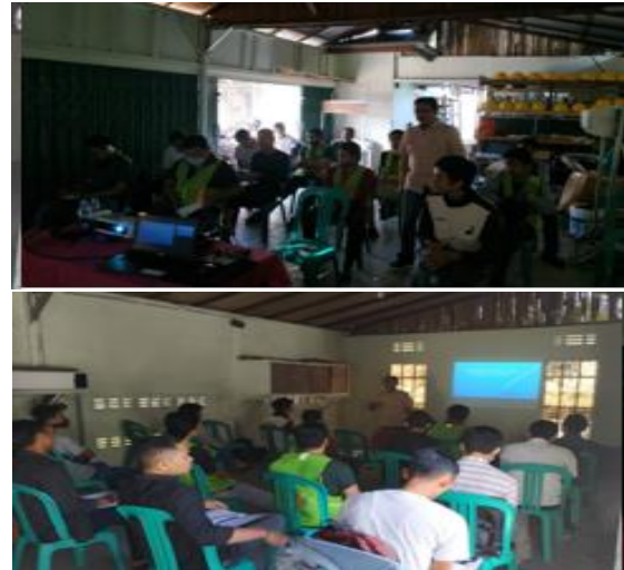
Gambar 7. Penyampaian materi kewirausahaan

Setelah materi kewirausahaan peserta dilakukan evaluasi tentang pengetahuan bagaimana melakukan perawatan dan pemasangan AC. Disini peserta mengikuti evaluasi terkait ilmu yang mereka terima pada saat mengikuti pelatihan. Hasilnya 12 dari 15 orang (80 %) dari peserta memperoleh nilai > 85 dan 20% peserta memperoleh nilai < dari 84.