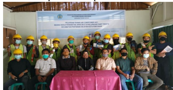
Gambar 8. Foto peserta bersama pemateri/instruktur pada penutupan pelatihan.

Setelah materi kewirausahaan peserta dilakukan evaluasi tentang pengetahuan bagaimana melakukan perawatan dan pemasangan AC. Disini peserta mengikuti evaluasi terkait ilmu yang mereka terima pada saat mengikuti pelatihan. Hasilnya 12 dari 15 orang (80 %) dari peserta memperoleh nilai > 85 dan 20% peserta memperoleh nilai < dari 84.