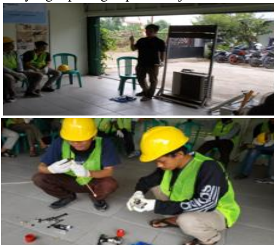
Gambar 6. Penjelasan materi oleh instruktur dan peserta praktek flaring dan swagging.

Hari ke 3, materi yang diberikan adalah praktek pemasangan AC. Peserta diberikan contoh dahulu bagaimana cara memasang AC sesuai standar baku. Setelah itu peserta diberi kesempatan secara berpasangan melakukan pemasangan AC dari awal hingga AC itu bekerja. Hasil dari praktek ini sebagian besar peserta dapat melakukannya dengan benar dan AC yang dipasang dapat bekerja.