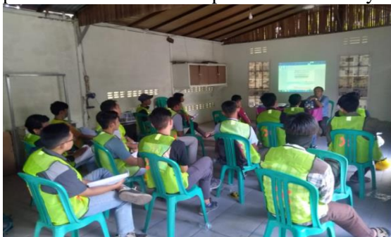
Gambar 4. Penyampaian materi teori pelatihan AC.

Pada hari I, peserta diberikan teori tentang penggunaan APD dan K3, anggota tim yang memberikan materi ini menyampaikan pentingnya APD dan K3. Pada materi ini selain modul yang telah diberikan ke peserta penerjemah juga menggunakan video tutorial bagaimana menggunakan peralatan APD. Bahkan pada kesempatan ini juga peserta diberikan kesempatan untuk mempraktek penggunaan APD seperti yang dicontohkan pada video tutorial. Berkaitan K3 juga dijelaskan bagaimana bahayanya listrik, bekerja ditempat ketinggian dan menggunakan peralatan dengan baik dan benar. Pada kesempatan ini juga peserta diberikan kesempatan untuk bertanya.