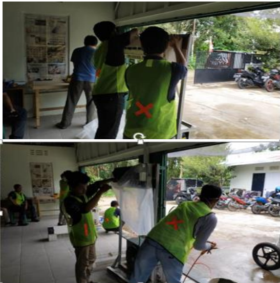
Gambar 5. Peserta mendengar penjelasan dan praktik pencucian AC

Hari ke 4, materi yang diberikan adalah kewirausahaan. Pada kesempatan ini anggota tim memberikan materi tentang bagaimana membangun usaha di era milenial yang berbasis IT, kemudian mempromosikan, memanager usaha serta memotivasi peserta agar berani membangun usaha secara mandiri maupun berkelompok.