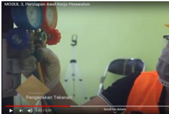
Gambar 2. Modul dan video tutorial yang disiapkan untuk pelatihan